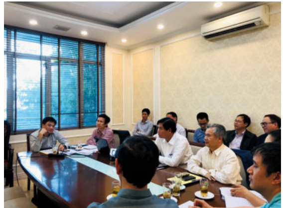
Toàn cảnh họp Hội đồng nghiệm thu

Bằng phương pháp nghiên cứu lý thuyết về cơ sở khoa học của nội bảo dưỡng bê tông kết hợp với nghiên cứu thực nghiệm đánh giá các tính chất dựa trên các tiêu chuẩn trong nước và quốc tế, nhóm nghiên cứu đã hoàn thành đề