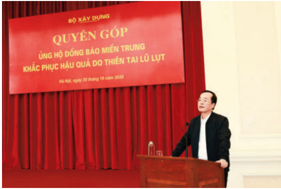
Bộ trưởng Phạm Hồng Hà phát biểu tại Lễ phát động

Trung, đặc biệt tại các tỉnh Thừa Thiên-Huế; Quảng Trị, Quảng Bình; Hà Tĩnh... Mưa lũ đã gây ngập lụt nghiêm trọng, nhiều khu dân cư bị chia cắt, cô lập, ảnh hưởng đến an toàn tính mạng, tài sản và đời sống nhân dân các tỉnh miền Trung. Tính đến nay, số người chết và mất tích đã lên đến hơn 100 người, nhiều người vẫn còn bị mất liên lạc; hàng nghìn ngôi nhà bị sập đổ, cuốn trôi. Nhiều công trình cơ sở hạ tầng giao thông, thủy lợi bị sạt lở, vùi lấp; cây trồng và thủy sản bị tổn thất rất lớn.