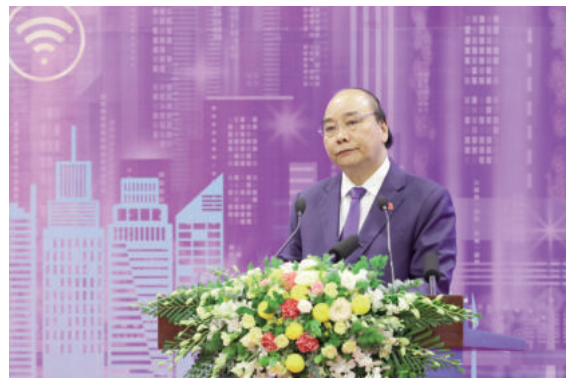
Thủ tướng Chính phủ Nguyễn Xuân Phúc phát biểu tại Diễn đàn

Phát biểu khai mạc Diễn đàn, Trưởng ban Kinh tế Trung ương Nguyễn Văn Bình cho biết: hiện nay quá trình đô thị hóa và quá trình chuyển đổi số đang diễn ra nhanh chóng trên toàn thế giới. Ước tính có đến 55% dân số toàn