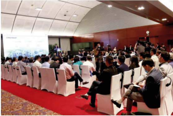
Toàn cảnh hội thảo

minh và phát triển bền vững với sự tham gia của nhiều thành phần trong xã hội.