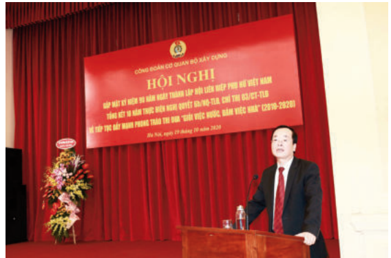
Bộ trưởng Phạm Hồng Hà phát biểu tại lễ gặp mặt

Trong những năm qua, hoạt động Công đoàn Cơ quan Bộ luôn nhận được sự quan tâm của Ban Cán sự Đảng, lãnh đạo Bộ, Đảng ủy Bộ Xây dựng, Công đoàn Xây dựng Việt Nam và cấp ủy, lãnh đạo các đơn vị thuộc Cơ quan Bộ Xây dựng. Nhờ đó, các phong trào thi đua yêu nước, đặc biệt là các phong trào nữ công như: “Giỏi việc nước, đảm việc nhà”, “Vượt khó, học tập, lao động sáng tạo, xây dựng gia đình hạnh phúc”, “Người mẹ có con ngoan, học giỏi” gắn với cuộc vận động “Tiếp tục đẩy mạnh học tập và làm theo tấm gương đạo đức Hồ Chí Minh” được chú trọng phát triển cả bề rộng và chiều sâu, góp phần quan trọng vào thực hiện và hoàn thành các nhiệm vụ chính trị của Bộ Xây dựng.