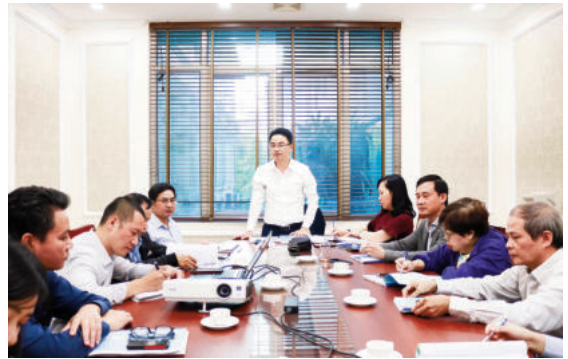
Toàn cảnh cuộc họp

Trong báo cáo của mình, nhóm nghiên cứu đã đưa ra đề xuất xây dựng danh mục tiêu chuẩn quốc gia ngành Xây dựng phục vụ phát triển đô thị thông minh tại Việt Nam, gồm 22 tiêu chuẩn thuộc 5 nhóm: quản lý đô thị thông minh, quy hoạch đô thị thông minh, cơ sở dữ liệu quy hoạch và quản lý đô thị thông minh, hạ tầng đô thị thông minh, thiết kế xây dựng và vận hành công trình.