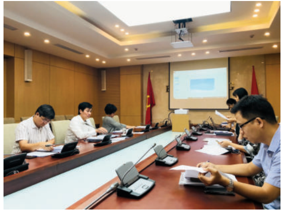
Toàn cảnh họp Hội đồng nghiệm thu Dự án

Trong giai đoạn vừa qua, Bộ Xây dựng đã chỉ đạo các đơn vị trực thuộc Bộ triển khai điều tra khảo sát đánh giá tác động của biến đổi khí hậu đến đô thị. Do thiếu khung hướng dẫn nên nhiều địa phương gặp lúng túng trong quá trình triển khai thực hiện. Mỗi địa phương có cách đánh giá khác nhau, lĩnh vực khác nhau, mức độ chuyên sâu khác nhau và chưa có sự thống