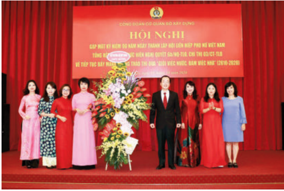
Bộ trưởng Phạm Hồng Hà tặng hoa chúc mừng tập thể nữ cán bộ, viên chức lao động Cơ quan Bộ Xây dựng