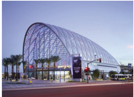
Trung tâm vận tải liên phương thức Vùng Anaheim (Mỹ)

- Các vị trí trung chuyển hành khách có các gian hàng, quầy dịch vụ và mái che có phải là