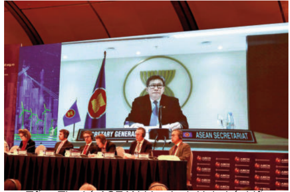
Tổng Thư ký ASEAN Lim Jock Hoi phát biểu trực tuyến tại Diễn đàn

Bày tỏ cảm ơn sâu sắc các lãnh đạo cấp cao của các quốc gia thành viên, ngài Tổng thư ký ASEAN, Ban Thư ký ASEAN, các đối tác, bạn bè quốc tế đã và đang tiếp tục đóng góp