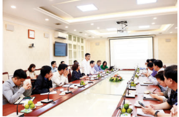
Toàn cảnh buổi tập huấn

Mục tiêu Chương trình tập huấn nhằm giúp các đồng chí lãnh đạo các Cục, Vụ thuộc Bộ Xây dựng nắm bắt và chỉ đạo triển khai kịp thời việc thống kê, rà soát, đánh giá, tính chi phí tuân thủ