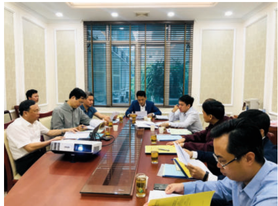
Toàn cảnh họp Hội đồng nghiệm thu

Theo nhận xét của các thành viên Hội đồng, dự thảo tiêu chuẩn được biên soạn có đầy đủ các nội dung về yêu cầu kỹ thuật chung, kích thước và cấu tạo, hướng dẫn tính toán thiết kế..., đáp ứng được việc thiết kế bu lông neo trước khi đổ bê tông, bu lông neo sau khi kết cấu đã hoàn thiện. Các phụ lục được xây dựng