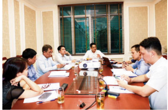
Toàn cảnh cuộc họp

Tiêu chuẩn này không áp dụng trong các trường hợp: Khi sản xuất các cấu kiện bê tông và bê tông cốt thép đúc sẵn; khi sản xuất, thi công và nghiệm thu các cấu kiện, kết cấu bê tông và bê tông cốt thép sử dụng bê tông tổ ong, bê tông cốt liệu rỗng và bê tông siêu nặng; khi sản xuất, thi công và nghiệm thu các cấu kiện và kết cấu sử dụng các loại bê tông đặc biệt khác; đối với các cấu kiện thi công bằng