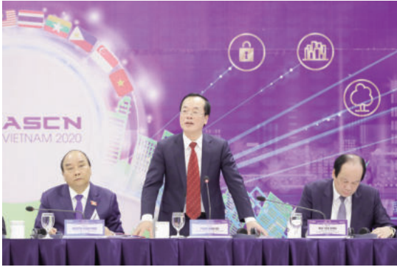
Bộ trưởng Phạm Hồng Hà phát biểu tại Diễn đàn

hạ tầng kỹ thuật và hạ tầng xã hội. Do đó, yêu cầu phát triển đô thị thông minh bền vững là hết sức cần thiết.