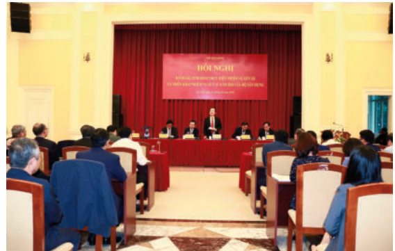
Toàn cảnh hội nghị