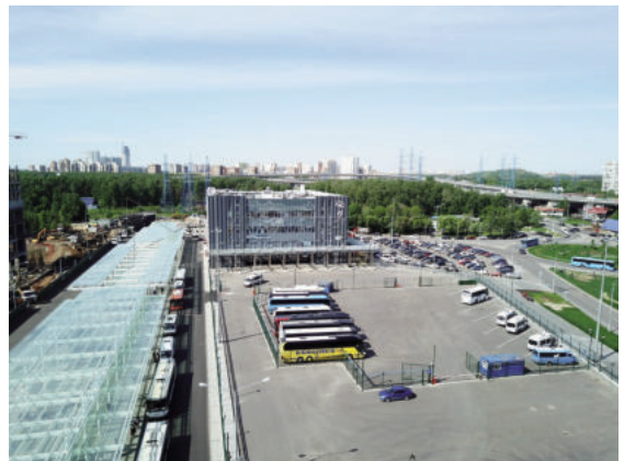
Đầu mối giao thông Khovrino (Moskva, LB Nga)

Tiếp theo là khái niệm “liên phương thức” trong lĩnh vực vận chuyển hành khách. Do thuật ngữ “liên phương thức” không có trong các văn bản pháp quy của Liên bang Nga, tác giả sẽ trích dẫn các nguồn tài liệu khoa học - kỹ thuật khác. GS.S.Vakulenko định nghĩa vận chuyển hành khách liên phương thức là “di chuyển các nhóm hành khách theo một chuỗi hợp lý, trong đó, dưới sự điều hành của một tổ chức, việc vận chuyển hành khách bằng nhiều loại hình vận chuyển được thực hiện. Trong trường hợp này, hành khách sử dụng một loại giấy tờ thông hành thống nhất”. Như vậy, có thể hình dung