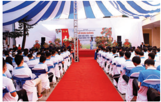
Toàn cảnh lễ Khai giảng

và xã hội phê duyệt thêm 2 ngành trọng điểm, nâng tổng số ngành, nghề trọng điểm đào tạo tại trường lên 5 ngành nghề.