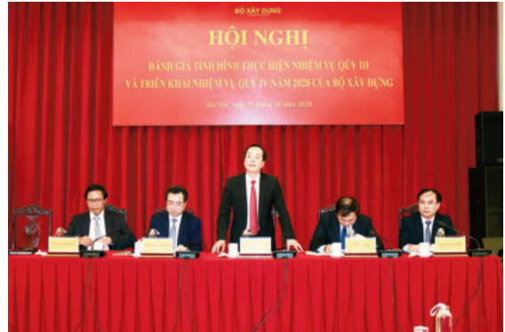
Bộ trưởng Phạm Hồng Hà phát biểu tại hội nghị

Nhờ đó, tính đến hết quý III/2020, ngành Xây dựng đã đạt được nhiều kết quả quan trọng. Cụ thể, mức tăng trưởng của ngành đạt 5,02% (cao hơn mức tăng 4,5% của Quý II/2020); tỷ lệ đô thị hóa toàn quốc ước đạt 40% (tăng 2% so với năm 2019); tỷ lệ người dân đô thị được cung cấp nước sạch qua hệ thống cấp nước tập trung ước đạt 90%; tỷ lệ thoát nước sạch 18% (giảm 1% so với năm 2019); tỷ lệ thu gom và xử lý chất thải rắn sinh hoạt đô thị ước đạt 91%; tỷ lệ quy hoạch chung xây dựng đô thị và quy hoạch xây dựng nông thôn đều đạt 100%; diện tích bình quân nhà ở toàn quốc ước đạt 23,6m 2 sàn/người/năm; sản xuất xi măng, gạch ốp lát, sứ vệ sinh, kính xây dựng, gạch không nung đều đạt hoặc vượt kế