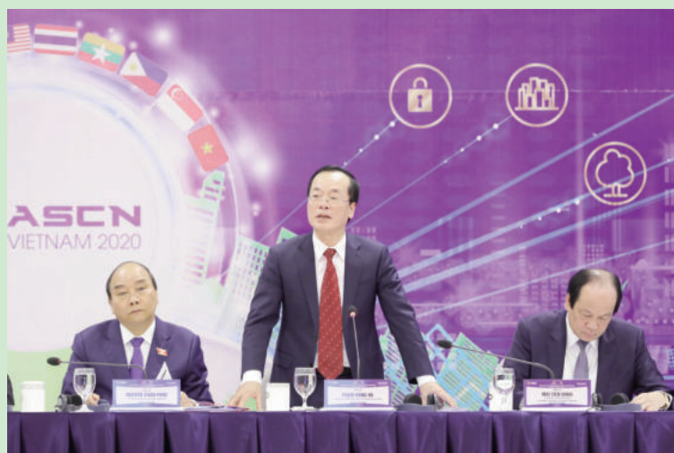
Bộ trưởng Phạm Hồng Hà phát biểu tại Diễn đàn