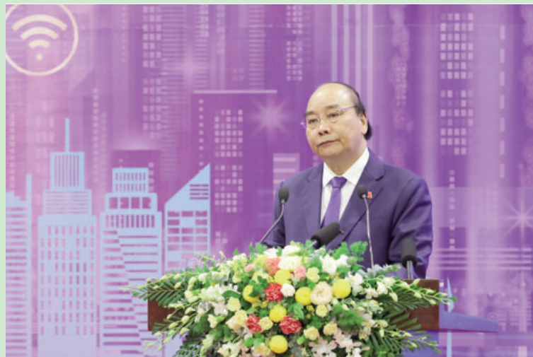
Thủ tướng Chính phủ Nguyễn Xuân Phúc phát biểu tại Diễn đàn