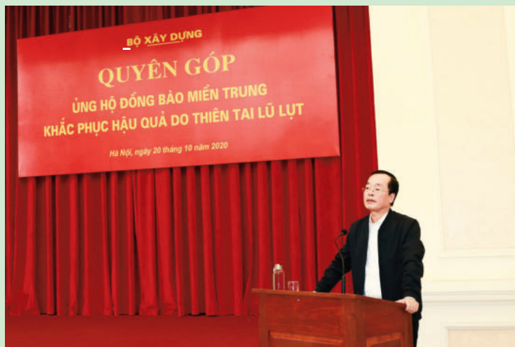
Bộ trưởng Phạm Hồng Hà phát biểu tại Lễ phát động