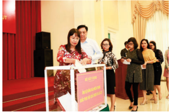
Công chức, viên chức ngành Xây dựng chung tay, góp sức cùng đồng bào miền Trung khắc phục hậu quả nặng nề do thiên tai

Phát biểu tại lễ phát động, Bộ trưởng Phạm Hồng Hà nhấn mạnh: những ngày vừa qua, khu vực Miền Trung đã và đang phải hứng chịu loạt thiên tai hết sức nặng nề gây thiệt hại về con