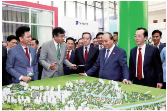
Thủ tướng Nguyễn Xuân Phúc, Trưởng ban Kinh tế Trung ương Nguyễn Văn Bình, Bộ trưởng Phạm Hồng Hà và các đại biểu tham quan các gian hàng triển lãm về đô thị thông minh

Tham gia phát biểu trực tuyến tại Diễn đàn, ông Lim Jock Hoi - Tổng Thư ký ASEAN khuyến nghị: Các quốc gia trong khu vực cần đầu tư vào cơ sở hạ tầng kỹ thuật số để ASEAN có một nền tảng công nghệ mạnh mẽ cho các thành phố thông minh; thông qua công tác quản lý, hài hòa các quy định và thúc đẩy trao đổi dữ liệu trong nền kinh tế kỹ thuật số giữa các quốc gia thành viên ASEAN để giải quyết các thách thức đô thị và tạo ra các nguồn tăng trưởng mới; cần tăng cường chia sẻ các giải pháp thực tiễn hiệu quả để giúp giảm khoảng cách trong việc tiếp cận thông tin y tế và dịch vụ chăm sóc sức khỏe của người nghèo thành