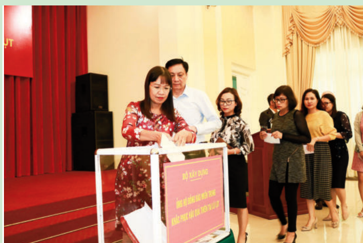
Công chức, viên chức ngành Xây dựng chung tay, góp sức cùng đồng bào miền Trung khắc phục hậu quả nặng nề do thiên tai