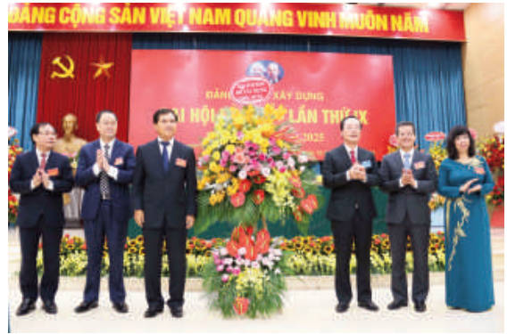
Bí thư Ban Cán sự Đảng, Bộ trưởng Bộ Xây dựng Phạm Hồng Hà tặng lẵng hoa chúc mừng Đại hội

Đảng viên theo tư tưởng, đạo đức, phong cách Hồ Chí Minh.