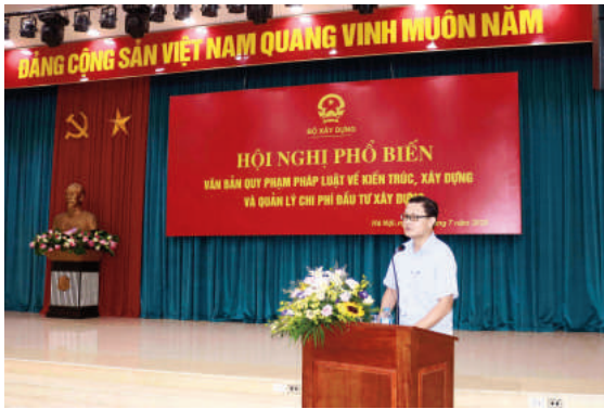
Phó Vụ trưởng Vụ Quy hoạch - Kiến trúc Hồ Chí Minh trình bày tham luận tại Hội nghị

Cụ thể, về quản lý kiến trúc: Luật Kiến trúc bổ sung (luật hóa) quy định, yêu cầu về bản sắc văn hóa dân tộc trong kiến trúc nhằm cụ thể hóa các chủ trương, đường lối chính sách của Đảng và Nhà nước về phát triển nền văn hóa Việt Nam tiên tiến, đậm đà bản sắc văn hóa dân tộc, trong đó có lĩnh vực kiến trúc. Trong đó, bổ sung một điều riêng về bản sắc văn hóa dân tộc trong kiến trúc bao gồm các đặc điểm, tính chất tiêu biểu và đặc trưng tạo nên một phong cách riêng của kiến trúc Việt Nam về điều kiện tự nhiên, kinh tế - xã hội, văn hóa nghệ thuật; phong tục tập quán sinh hoạt của địa phương; phương pháp kỹ thuật xây dựng và sử dụng vật liệu xây dựng. Đồng thời, quy định các địa phương có trách nhiệm cụ thể hóa các giá trị bản sắc văn hóa dân tộc trong Quy chế quản lý kiến trúc để bảo đảm khả thi, phù hợp với từng vùng, miền, địa phương do mình quản lý; bổ sung quy định về bảo tồn, phát huy giá trị bản sắc văn hóa dân tộc vào các nội dung có liên quan trong dự thảo Luật như nguyên tắc hoạt động kiến trúc, yêu cầu quản lý kiến trúc.