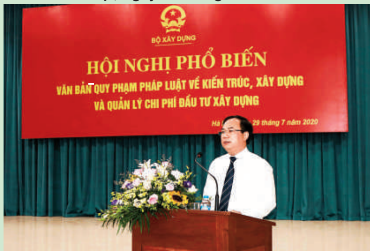
Thủ tướng Nguyễn Văn Sinh phát biểu tại Hội nghị