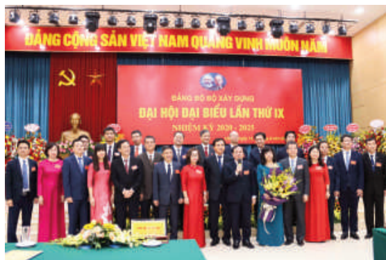
Ra mắt Ban Chấp hành Đảng bộ Bộ Xây dựng khóa IX, nhiệm kỳ 2020 - 2025.

soạn thảo nhiều văn bản QPPL phục vụ công tác quản lý nhà nước của Ngành. Các đơn vị khối khoa học công nghệ đang từng bước đổi mới cơ chế tài chính, thực hiện kinh phí tự chủ gắn với thực hiện nhiệm vụ thường xuyên; chủ động tham gia vào công tác phục vụ quản lý nhà nước của Bộ, đồng thời đẩy mạnh các hoạt động dịch vụ, thương mại hóa các sản phẩm nghiên cứu để thực hiện cơ chế tự chủ. Các đơn vị khối y tế làm tốt công tác chăm sóc sức khỏe cán bộ, công nhân viên chức và người lao động. Các đơn vị thuộc khối thông tin, báo, tạp chí, xuất bản thực hiện tốt công tác thông tin, tuyên truyền và có nhiều chuyển biến tích cực, phản ánh hoạt động của ngành trên các lĩnh vực.