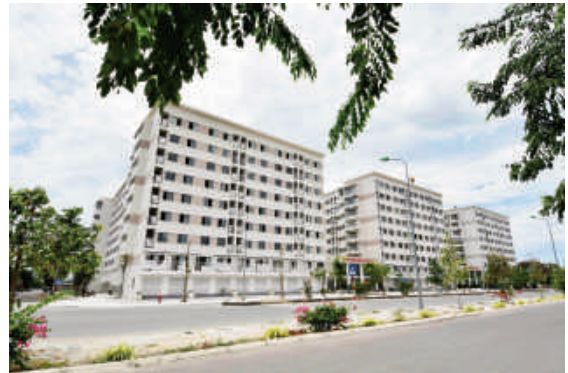
Toàn cảnh dự án NOWXXH-01

Đại hội Đại biểu Đảng bộ tỉnh Khánh Hòa lần thứ XVIII, nhiệm kỳ 2020 - 2025.