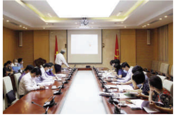
Toàn cảnh cuộc họp

Bảo Quang, Bàu Trâm, Bình Lộc, Hàng Gòn với tổng diện tích là 191,75 km 2 , tổng dân số hiện trạng 154.768 người.