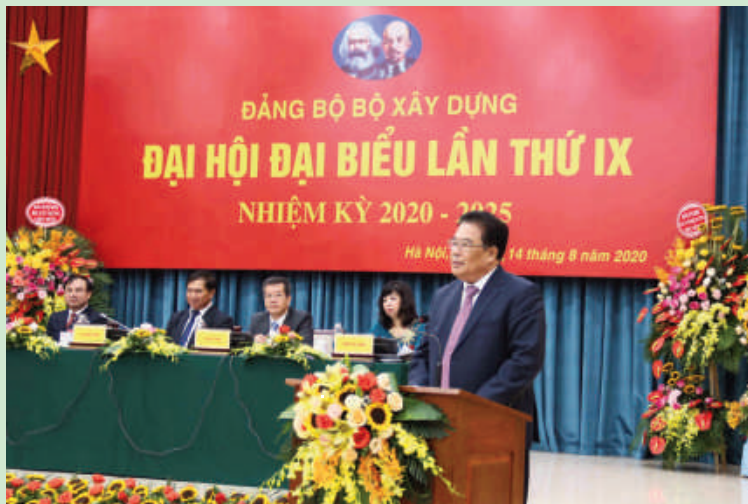
Đồng chí Sơn Minh Thắng, Ủy viên BCH Trung ương Đảng, Bí thư Đảng ủy Khối Cơ quan Trung ương phát biểu chỉ đạo Đại hội.