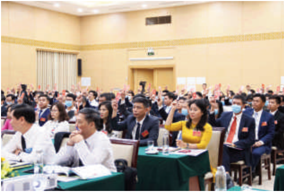
Toàn cảnh Đại hội