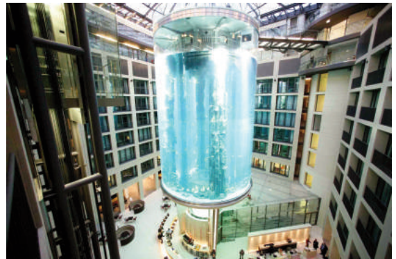
Hình 4: Thang máy “ẩn” bên trong bể cá lớn tại khách sạn Radisson Blu (Berlin, Đức) trúc bên trong của công trình (Hình 2).

chuyến hành khách lớn nhất thế giới này sẽ cứu những con đường mòn trên núi khỏi sự quá tải. Tuy nhiên những người phản đối cho rằng khu vực có hơn 5 triệu lượt khách ghé thăm mỗi năm đã bão hòa với lượng khách du lịch, và một điểm hấp dẫn khác khiến lượng du khách tăng thêm sẽ chỉ đưa lại nhiều hệ quả xấu cho môi trường. Dự án cũng vấp phải sự phê phán mạnh từ các nhà môi trường, do đây được coi là vùng lõi khu vực bảo tồn. Cuối cùng, thang máy vẫn được xây dựng phục vụ khách du lịch, và thực sự góp phần vào danh tiếng ngày càng tăng lên của khu vực, và của cả tỉnh Hồ Nam nói chung.