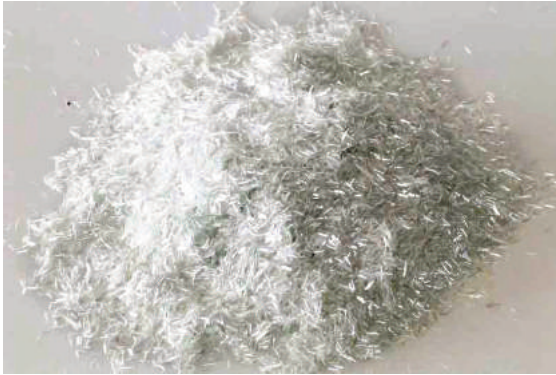
Ảnh 1: Sợi thủy tinh được sử dụng trong bê tông ở 3 dạng - dạng sợi riêng biệt

nhược điểm của các biện pháp truyền thống, hơn nữa có một số ưu điểm rõ rệt.