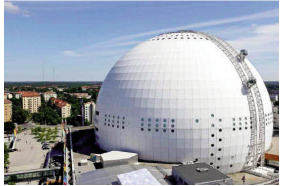
Hình 6: Thang máy SkyView của tổ hợp thể thao Globen Arena (Stockholm, Thụy Điển)

Nếu chọn tour du lịch dọc theo các kênh này, du khách có thể quan sát từ bên trong hoạt