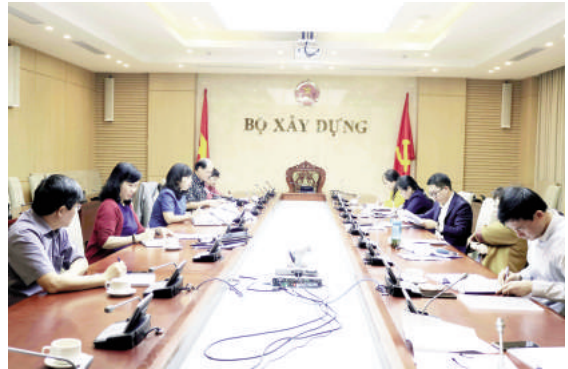
Toàn cảnh cuộc họp

Mục tiêu cụ thể của đề tài là đánh giá tổng quan xu thế phát triển đô thị gắn với kịch bản