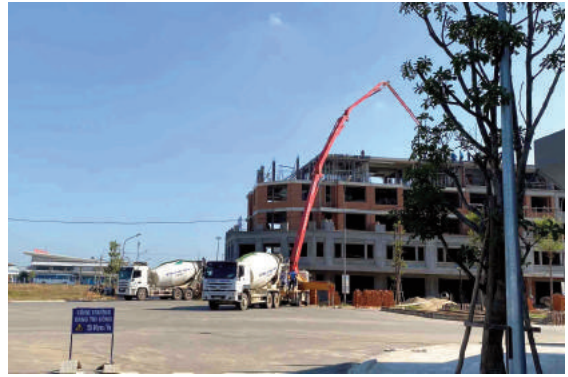
Dự án Phú Mỹ, tỉnh Quảng Ngãi sẵn sàng chào đón các cư dân đến định cư

Cùng với việc xây dựng các kịch bản ứng phó, từ thực tiễn hoạt động sản xuất kinh doanh và kinh nghiệm hơn 30 năm hoạt động trong lĩnh vực đầu tư kinh doanh bất động sản, trải qua nhiều thời kỳ thị trường biến động, HUD cũng đề xuất với cấp có thẩm quyền để góp phần tháo gỡ khó khăn cho các doanh nghiệp đầu tư, kinh doanh bất động sản. Các đề xuất tập trung vào các chính sách tài khóa, tín dụng ngân hàng, trong đó có đề xuất Chính phủ và