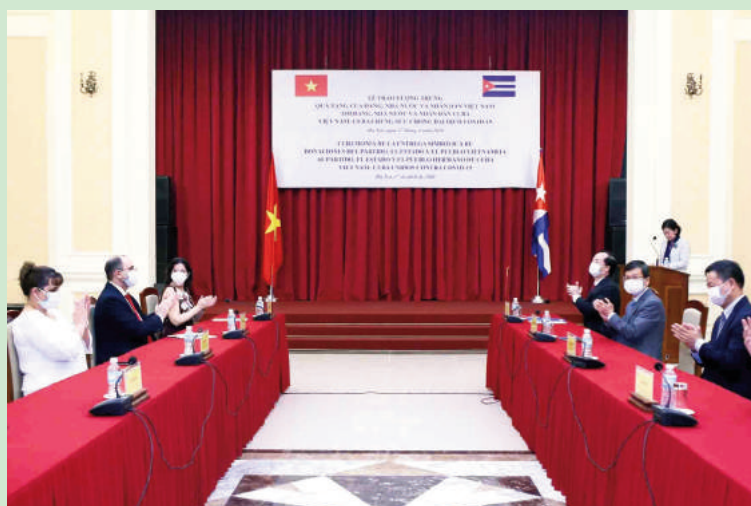
Toàn cảnh buổi Lễ