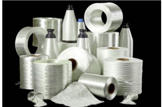
Ảnh 2: Dạng cuộn

Polyme cốt sợi thực chất là các sợi công nghiệp cường độ cao trộn với polyme. Bản thân polymer không có khả năng chịu lực cao, nhưng có vai trò quan trọng trong quá trình tổng hợp các sợi, bảo vệ sợi tránh tác động của hóa chất và tia cực tím, và các tác động cơ học.