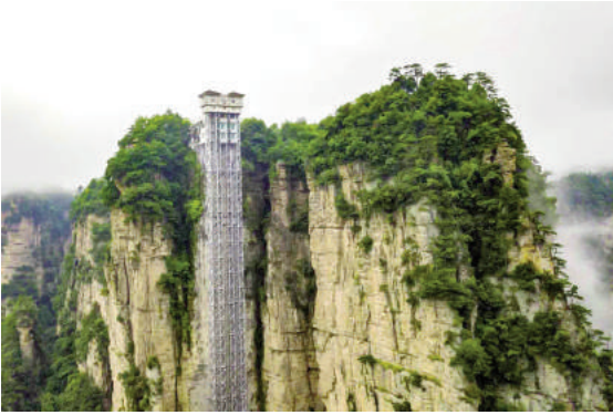
Hình 1: Bailong Elevator trong khu công viên quốc gia Trương Gia Giới (Hồ Nam, Trung Quốc)