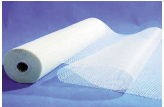
Ảnh 3: Dạng lưới

Kinh nghiệm cho thấy kết cấu được gia cố có thể chịu các tải trọng bên ngoài, và có cường độ cao. Các đặc tính của vật liệu FRP thay đổi tùy theo loại sợi được sử dụng (sợi thủy tinh, sợi carbon), lượng sợi trong vật liệu kết dính và nhiều yếu tố khác.