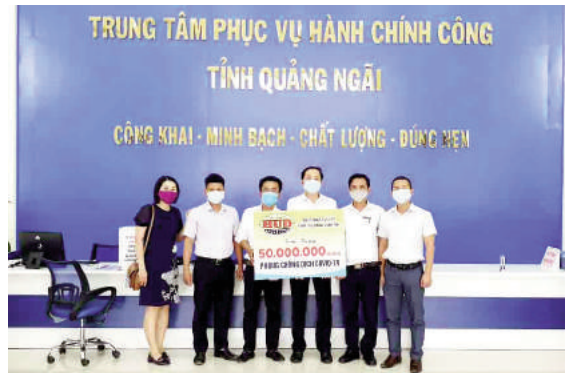
HUD tặng kinh phí để mua trang thiết bị, vật tư y tế phục vụ việc phòng chống dịch của Trung tâm phục vụ Hành chính công tỉnh Quảng Ngãi

Những tác động của đại dịch Covid-19 đã ảnh hưởng rất lớn đến việc hoàn thành các chỉ tiêu sản xuất kinh doanh quý I và kế hoạch cả năm 2020 của HUD. Kết thúc Quý I/2020, các chỉ tiêu thực hiện Quý chỉ chiếm trên dưới 10% Kế hoạch cả năm, và thấp hơn cùng kỳ 2019. Các quá trình sản xuất kinh doanh, từ công tác chuẩn bị đầu tư, bồi thường giải phóng mặt bằng, thi công xây lắp và đặc biệt là công tác kinh doanh, thu hồi vốn gặp rất nhiều khó khăn, doanh thu, lợi nhuận sụt giảm dẫn tới thu nhập của người lao động giảm sút và nguy cơ phải giảm việc làm, giảm lao động.