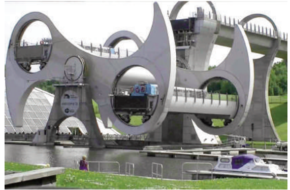
Hình 3: Hệ thống thang nâng thủy lực dành cho tàu thuyền qua kênh tại Scotland