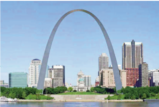
Hình 2: Arch Gateway St. Louis (Mỹ)