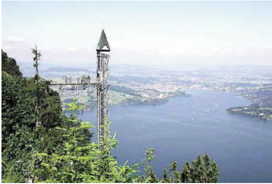
Hình 5: Thang máy lên đỉnh đồi Hammetschwand (Thụy Sĩ) - thang máy cao nhất châu Âu

Ban đầu, các kênh liên kết với nhau bằng mười một cửa cống. Để vượt qua tất cả mười một cửa cống này, các tàu thuyền phải mất hơn ba giờ đồng hồ, rất bất lợi. Trong những năm 1930, việc vận chuyển bằng tàu thuyền trong khu vực đã bị đình trệ, các cửa cống bị lấp do không còn cần thiết. Cho tới năm 1998, chính quyền đã quyết định khôi phục dự án này nhằm kết nối hai đô thị Glasgow và Edinburgh. Mô hình cũ tạo sự liên kết các kênh bằng các cửa cống được quyết định thay thế bằng một hệ thống nâng dành cho tàu thuyền vô cùng độc đáo. Falkirk Wheel đã được khánh thành vào tháng 5/2002.