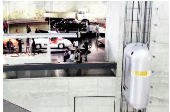
Hình 8: Thang máy trong bảo tàng của Tập đoàn Mercedes - Benz giống dây chuyền sản xuất ô tô

Để lắp đặt các khối cầu, nhất thiết phải có sự hỗ trợ của máy bay trực thăng và các nhà leo núi chuyên nghiệp. SkyView được chế tạo bởi công ty chuyên sản xuất thang máy trượt tuyết nổi tiếng của Thụy Điển, và nhanh chóng