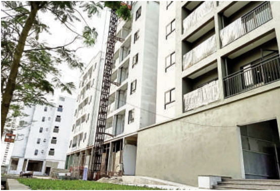
Dự án NOXH 08 Khu ĐTM Thanh Lâm Đại Thịnh 2, Hà Nội, đang được khẩn trương hoàn thiện các thủ tục để sẵn sàng cho công tác kinh doanh trong Quý II/2020

Chỉ đạo phòng chống dịch bệnh Covid-19 do đồng chí Tổng giám đốc Tổng công ty làm Trưởng ban; ban hành kế hoạch tổng thể và thường xuyên cập nhật tình hình, diễn biến của dịch bệnh để tổ chức tuyên truyền, thực hiện các biện pháp cụ thể, phù hợp ứng phó với dịch bệnh cũng như chỉ đạo, điều hành hoạt động sản xuất kinh doanh.