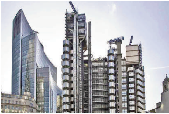
Hình 7: Lloyd Building với hệ thống thang máy và các hệ thống kỹ thuật nằm bên ngoài

trắng cao 85m, đường kính 110m ở phía nam Stockholm còn có tên gọi khác là Ericsson Globe. Tổ hợp thể thao - giải trí được hoàn thành từ năm 1989. Hệ thống thang nâng độc đáo, bổ sung cho nét độc đáo của Globen Arena được xây sau đó khá lâu, từ 2004 - 2010. Các số liệu thống kê được công bố cho thấy trong năm đầu tiên hoạt động, thang đã vận chuyển 160 nghìn người (Hình 6).