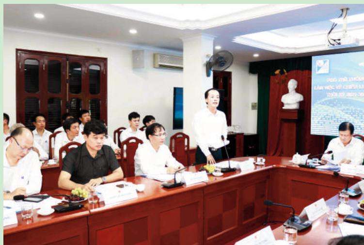
Bộ trưởng Bộ Xây dựng Phạm Hồng Hà phát biểu tại buổi làm việc