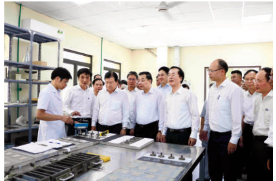
Phó Thủ tướng Trịnh Đình Dũng, Bộ trưởng Phạm Hồng Hà, Bộ trưởng Chu Ngọc Anh thăm cơ sở nghiên cứu, thí nghiệm của Viện Vật liệu xây dựng

tài nguyên, cơ sở hạ tầng, yêu cầu phát triển kinh tế của địa phương.