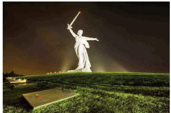
Tượng đài "Mẹ Tổ quốc kêu gọi" trên đồi Mamaev (Volgograd, Nga)

Cây xanh - về nguyên tắc - có những đặc điểm riêng, gồm nhiều loài khác nhau, và có những phong cách biểu cảm kiến trúc khác nhau. Các công viên tưởng niệm với giải pháp kiến trúc - không gian phát triển trở thành những bảo tàng ngoài trời độc đáo. Các khu vực này là nơi du khách và người dân viếng thăm không chỉ vào ban ngày mà cả buổi tối, do đó hình ảnh cũng cần thay đổi tùy theo thời điểm trong ngày. Trên thực tế, các hệ thống chiếu sáng LED động học mới và hệ thống điều khiển ánh sáng được lập trình đã được áp dụng,