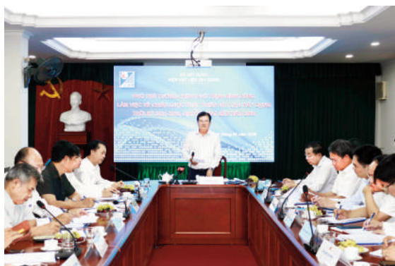
Phó Thủ tướng Trịnh Đình Dũng phát biểu tại buổi làm việc

hoàn thiện thể chế nhằm nâng cao vai trò quản lý Nhà nước đồng thời tạo điều kiện thuận lợi để thị trường VLXD Việt Nam phát triển.