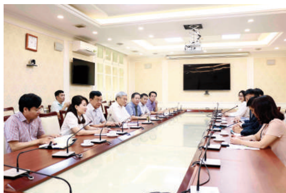
Toàn cảnh buổi làm việc

Song song với hoạt động trên, nhằm tăng cường mối quan hệ bền vững giữa Việt Nam và Nhật Bản, các dự án phát triển nguồn nhân lực cũng như hợp tác với chính quyền địa phương Nhật Bản, các tổ chức phi chính phủ (NGO)... cũng đóng vai trò vô cùng quan trọng. JICA cũng sẽ tiếp tục mở rộng các dự án phát triển tận dụng tri thức của các doanh nghiệp Nhật Bản. Hơn thế, dựa trên nền tảng mà người tiền nhiệm của tôi là ông Konaka và nhiều lớp đàn anh đi trước đã dày công vun đắp, tôi mong muốn phát huy hơn nữa mối quan hệ tốt đẹp giữa hai nước Việt Nam - Nhật Bản.