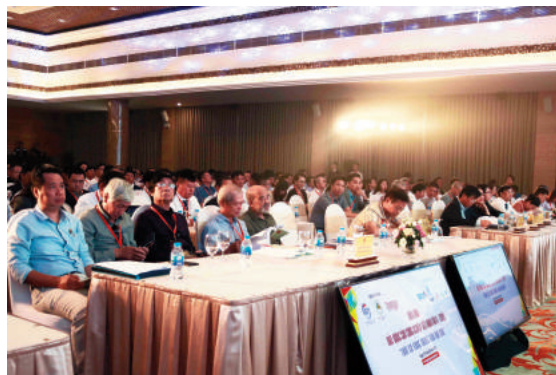
Toàn cảnh Diễn đàn