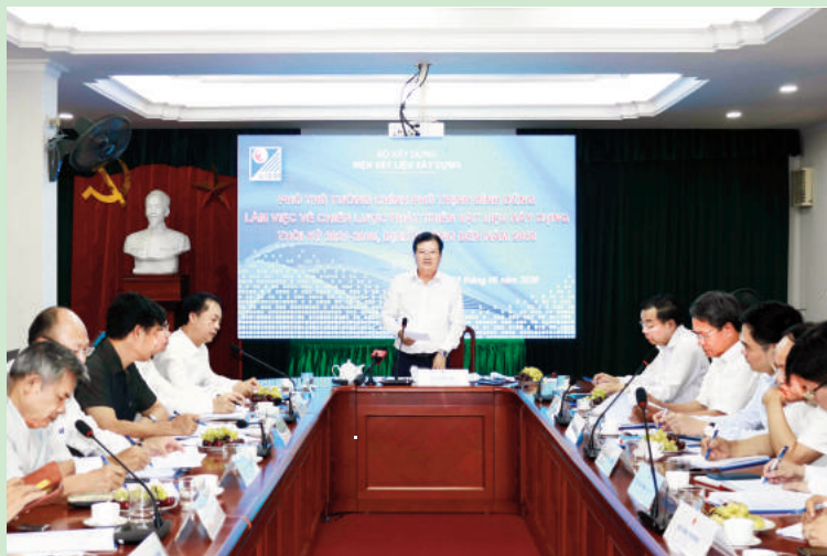
Phó Thủ tướng Trịnh Đình Dũng phát biểu tại buổi làm việc