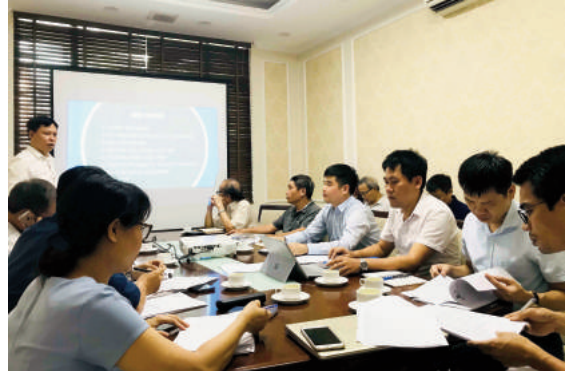
Toàn cảnh họp Hội đồng nghiệm thu

Mục tiêu soát xét QCVN 12:2014/BXD bao gồm các công việc như: rà soát các nội dung của QC, thu thập và tổng kết các ý kiến về tính khả thi và hiệu quả của QC trong quá trình sử dụng trong các dự án ngầm hiện đang thực hiện; làm sáng tỏ các cơ sở khoa học và thực tiễn của các bất cập trong nội dung QC và xác lập các nội dung cần sửa đổi, bổ sung cho QC sẽ biên soạn mới.