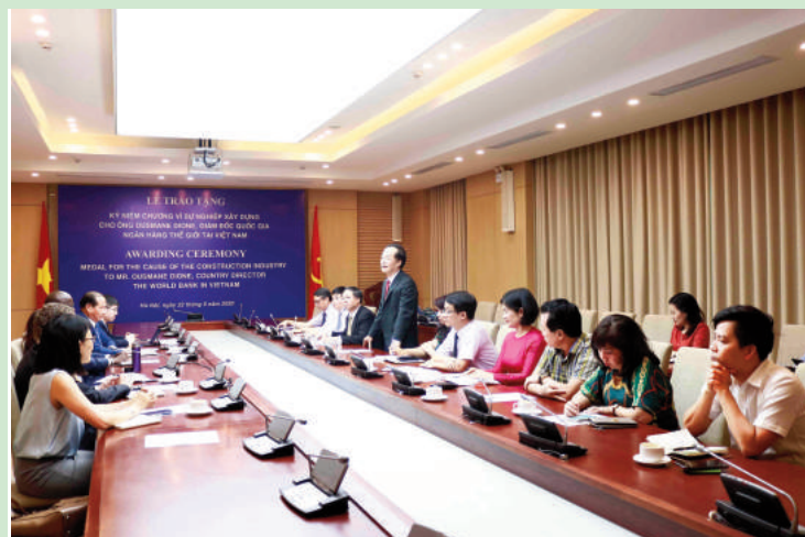
Bộ trưởng Phạm Hồng Hà phát biểu tại buổi lễ