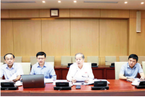
Chủ tịch UBND tỉnh Thừa Thiên - Huế Phan Ngọc Thọ tại buổi làm việc