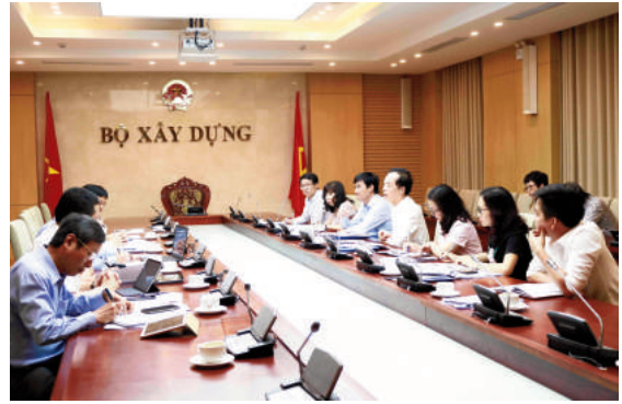
Toàn cảnh buổi làm việc