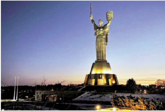
Tượng đài “Mẹ Tổ quốc” tại Kiev (Ucraina)