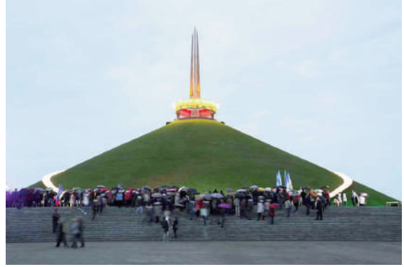
Tượng đài “Vinh quang thuộc về Hồng quân Liên Xô” tại Belarus

ảnh trong chiếu sáng tự nhiên. Các vật liệu để xây dựng tượng đài tăng thêm mức độ phức tạp của việc chiếu sáng.