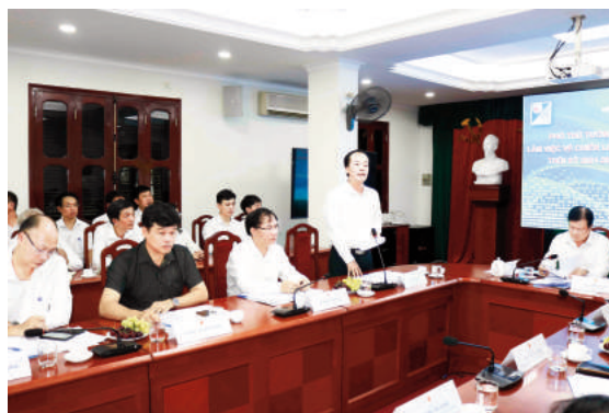
Bộ trưởng Bộ Xây dựng Phạm Hồng Hà phát biểu tại buổi làm việc

Để thực hiện được các mục tiêu trên, Phó Thủ tướng Trịnh Đình Dũng nhấn mạnh yêu cầu xây dựng, hoàn thiện Chiến lược Phát triển VLXD Việt Nam thời kỳ 2021 - 2030, định