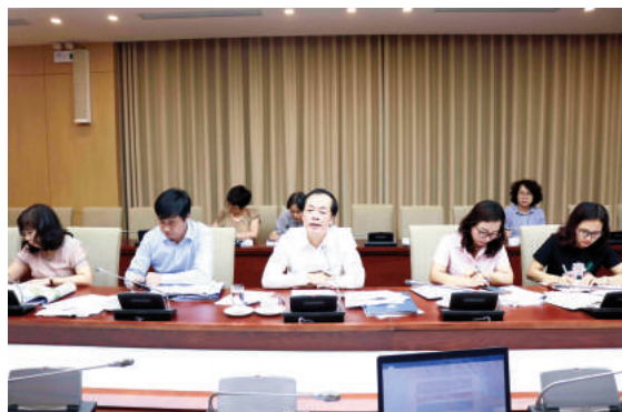
Bộ trưởng Phạm Hồng Hà phát biểu tại buổi làm việc

Trên cơ sở yêu cầu phát triển khách quan của hệ thống đô thị Việt Nam cũng như của tỉnh Thừa Thiên - Huế trong giai đoạn hiện nay, thực hiện định hướng quy hoạch tổng thể phát triển đô thị Việt Nam đến năm 2030 và chiến lược phát triển đô thị quốc gia giai đoạn 2012 - 2020, việc mở rộng địa giới hành chính đô thị và thành lập các phường thuộc thành phố Huế là sự phản