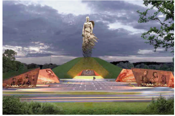
Khu tưởng niệm Rzhev đang tiếp tục được hoàn thiện trong năm 2020

Trong hơn 50 năm tồn tại của tượng đài chính trong toàn bộ tổ hợp, nhiều hư hỏng xảy ra là điều không tránh khỏi. Năm 2017, công cuộc tái thiết quy mô toàn bộ khu vực, đặc biệt tượng đài Mẹ Tổ quốc được khởi công, với nhiều công nghệ tiên tiến mới nhất trong lĩnh vực phục hồi các di tích đã được áp dụng. Thiết bị chiếu sáng được thay thế. Tất cả các công việc cần phải hoàn thành trước ngày 9/5/ 2020, mặc dù do đại dịch covid toàn cầu, các hoạt động nghi lễ sẽ diễn ra muộn hơn thời điểm dự kiến. Cần nói thêm: Kể từ năm 2016, trên đồi Mamaev trong những ngày lễ Chiến thắng của nhân dân Nga, chương trình dạ hội “Ánh sáng của Chiến thắng vĩ đại” đều đặn được tổ chức. Năm 2020, theo kế hoạch, ban tổ chức đã đổi mới chương trình và kỳ vọng sẽ trình diễn vũ khúc tuyệt đẹp của ánh sáng để khán giả thưởng thức. Có thể nói quần thể di tích- khu tưởng niệm đồi Mamaev là một hiện tượng mới, hiện tượng nổi bật của nghệ thuật Xô viết, là công trình kiến trúc có ý nghĩa nhất và quy mô lớn nhất nước Nga, đã và đang tiếp tục có ảnh hưởng lớn đến nghệ thuật tượng đài và xây