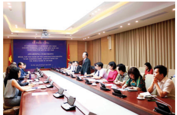
Bộ trưởng Phạm Hồng Hà phát biểu tại buổi lễ