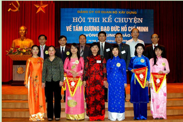
Các thí sinh dự thi vòng chung khảo Hội thi kể chuyện về tấm gương đạo đức Hồ Chí Minh và Ban Giám khảo hội thi