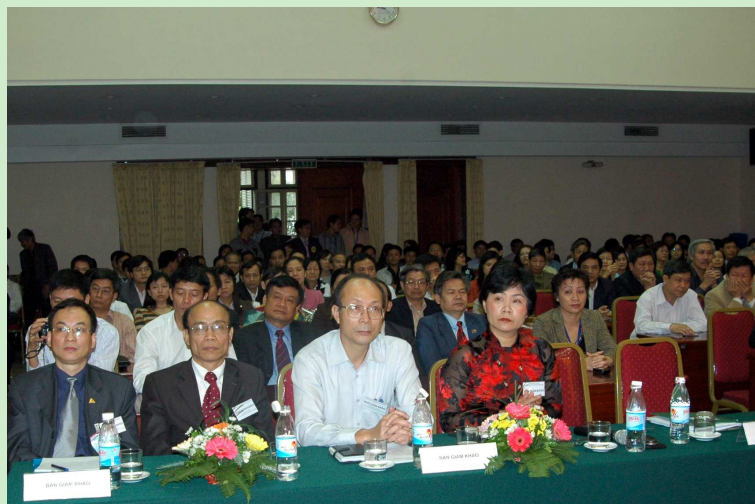
Quang cảnh Hội thi